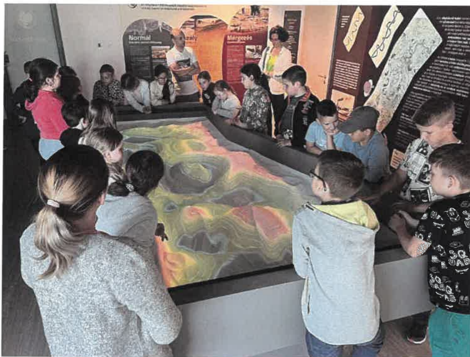
A látványos digitális homokozó a domborzati viszonyokról ad információt a KÉR-ÉSZ-TÉRben