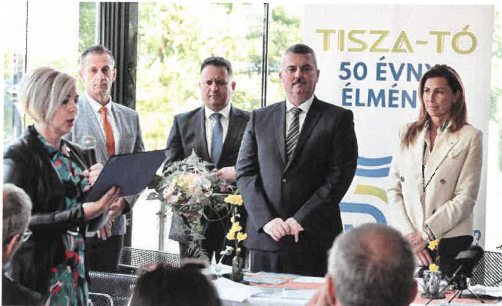
Miklósa Erika művésznő, a Tisza-tó Nagykövete lett a jubileum évében

A turisztikai feladatok ellátása napi szintű folyamatos aktivitást jelent az „Alföld Szíve” Térségi Turisztikai Egyesülettel és a Tisza-tavi Turisztikai Kerekasztallal szoros együttműködésben. 2023-ban ünnepelte a Tisza-tó a Kiskörei Vízlépcső / Tisza II. Vízlépcső 1973. május 16-ai átadásához kapcsolódóan az 50 éves jubileumát.