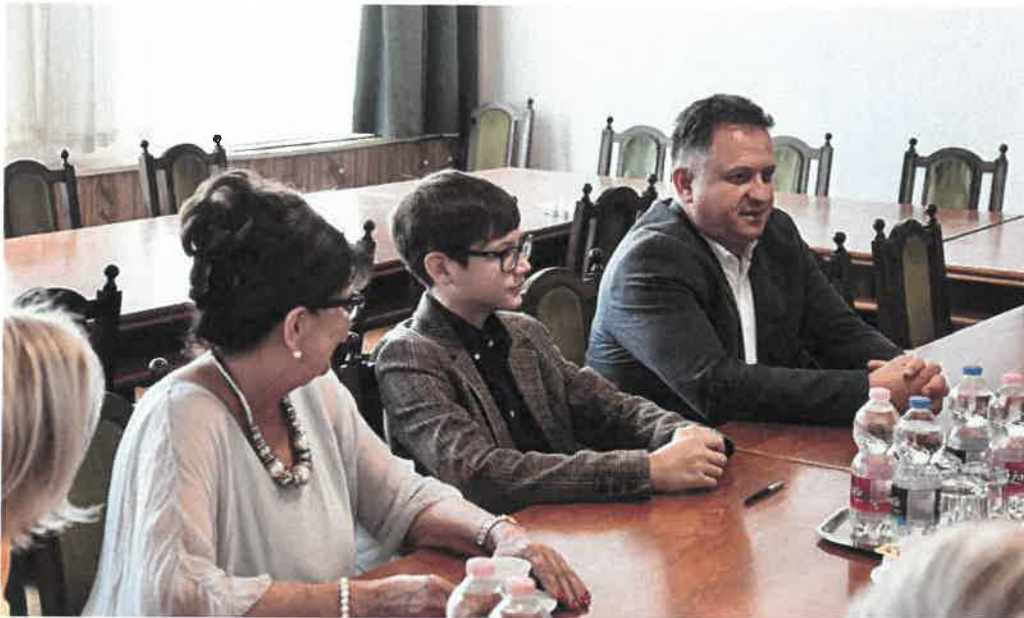
A Magyarország Kicsi Nagykövete Program keretében több formában is támogatjuk tehetséges diákjainkat