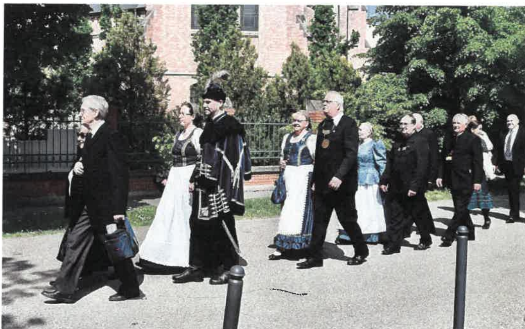
A Nemzeti Jászkun Emléknap tiszteletére az ökumenikus istentiszteletről hagyományosan a Szolnoki Légierő Zenekar zenei kísérete mellett vonulnak át a vendégek a Jászkun Emlékülésre, a Vármegyeházára

A Vármegyei Önkormányzat mindezek mellett további kötelező és önként vállalt feladatai között turizmusfejlesztéssel, kommunikációval, sportügyekkel, civil és társadalmi, ifjúsági- és nyugdíjas ügyekkel kapcsolatban is több jelentős programot valósított meg. Aktív kapcsolatot tartunk fent a Jász-Nagykun-Szolnok Vármegyei Diák Önkormányzattal, megyénk meghatározó civil szervezeteivel. 2020-tól jelentősen megnőtt a Vármegyei Önkormányzat humanitárius, jószolgálati akciókban, illetve a térségünket érintő, társadalmi támogatottságot igénylő felhívásokban való kezdeményező, koordinatív szerepe (pl. Magyar Református Szeretetszolgálat, Ökumenikus Segélyszervezet, Katolikus Karitasz akcióinak támogatása, könyvadományok célba juttatása, karácsonyi adománygyűjtés).