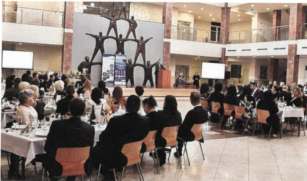
2023. december 1-jén nagyszabású turisztikai gálán először adtuk át a Jász-Nagykun-Szolnok és a Tisza-tó Turizmusáért díjakat, a turisztikai szakmában dolgozók iránti megbecsülésünk jeleként